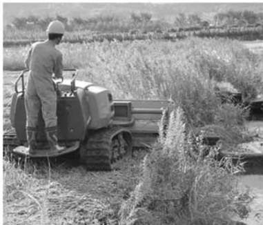
際まで刈込めるスライディング機構