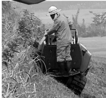
運転席自動水平装置で安全作業