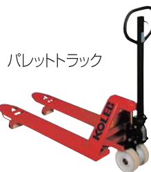
パレットトラック